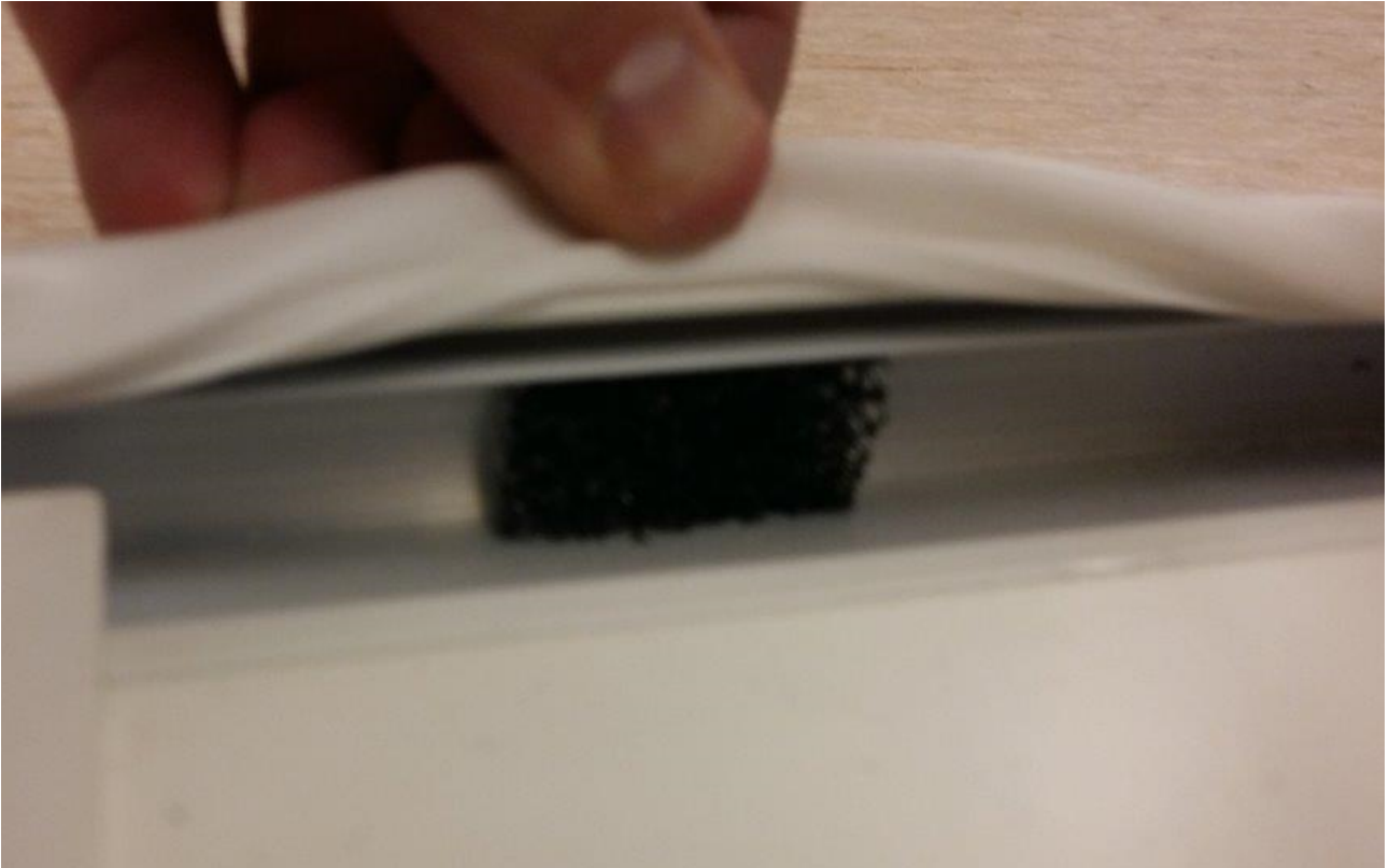
Osa jää tiivisteeseen alle vesireiän päälle